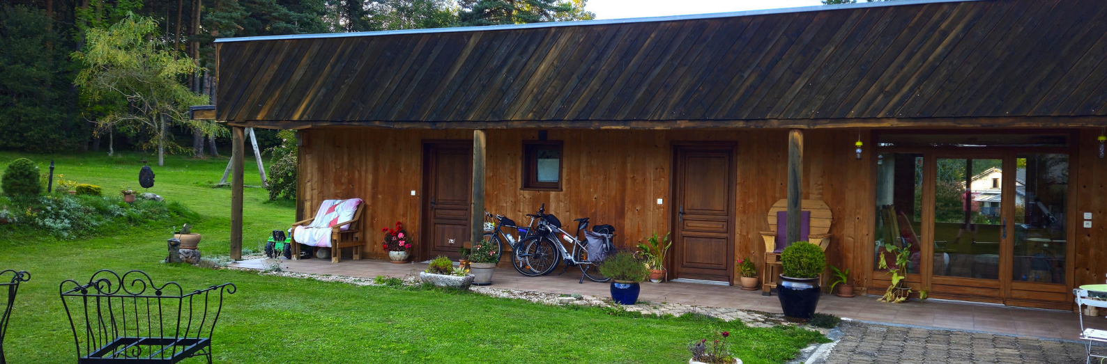
Chambre d'hôtes La Jouane • Saint-Julien du Pinet