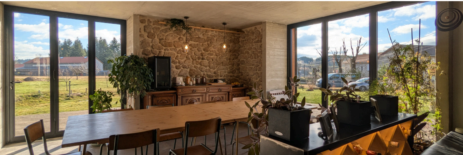
Chambre d'hôtes la Maison Longue • Raucoules