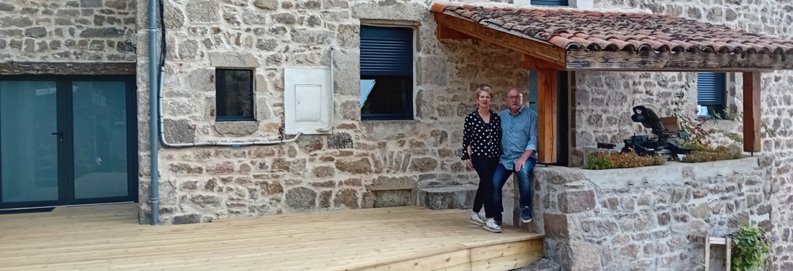
Chambre d'hôtes Au Chant de l'Eau • Saint-Julien Molin Molette